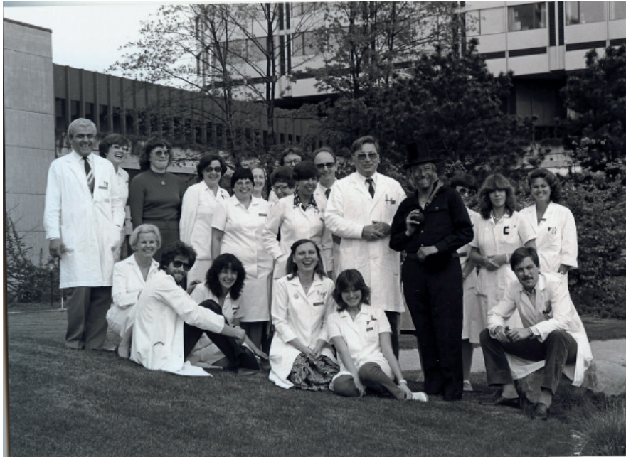
Abb. 2: Personal des eigenständigen Institutes 1982

Seit 1972 ist die Radio-Onkologie ein selbstständiges Institut am Universitätsspital (Abb. 2). Vor allem durch internationale Kooperationen mit renomierten onkologischen Arbeits- und Studiengruppen der USA konnte sich die Strahlentherapie als wesentliche Säule der onkologischen Therapie etablieren.