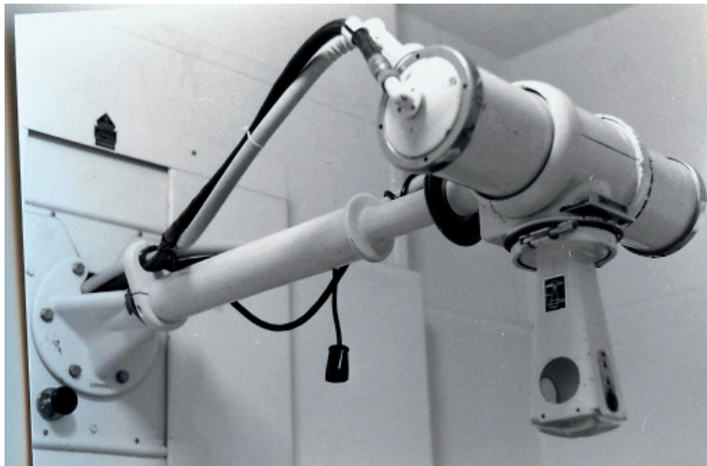
Abb. 1: Konventionelles Röntgentherapiegerät 1975